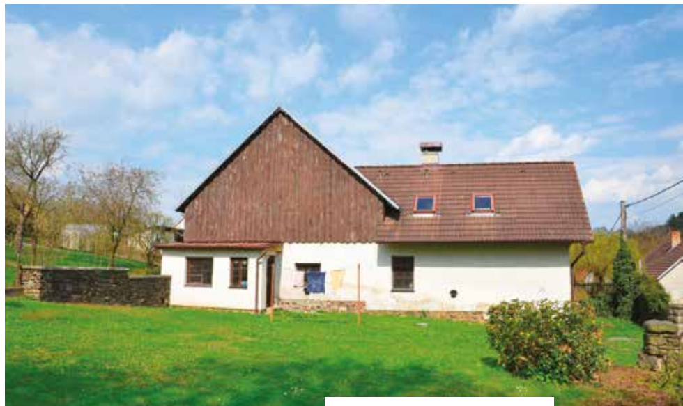
↑ Původní stav domu